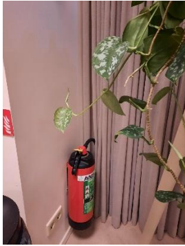
bij deur naar binnentuin