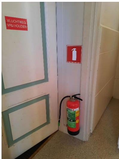
Kerkzaal achter liturgisch centrum