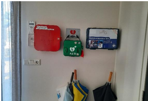
AED / Verband/EHBO-does en BHV-trommel

In het centrum Zinn en de kerkzaal zijn de volgende hulpmiddelen aanwezig: