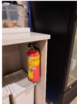
in de keuken onder aanrecht naast koelkast