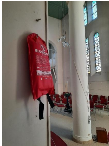
Achterwand liturgisch centrum links en rechts